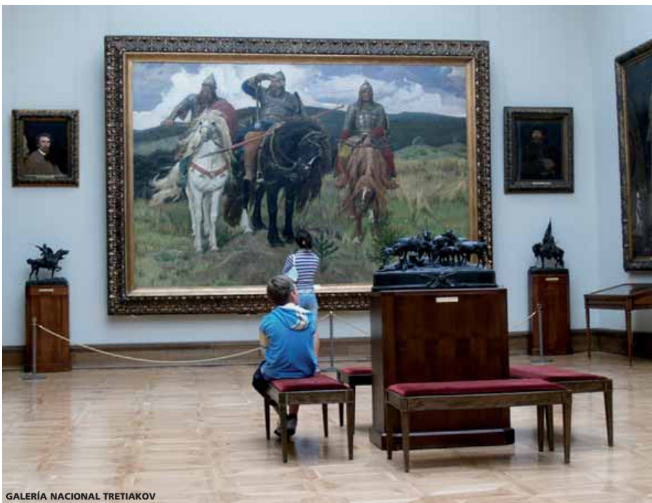
GALERÍA NACIONAL TRETIAKOV