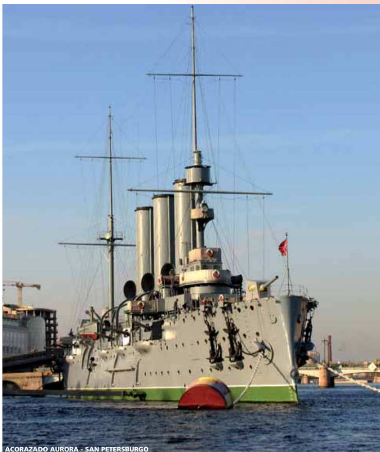
ACORAZADO AURORA - SAN PETERSBURGO