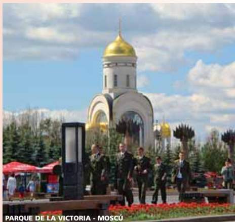
PARQUE DE LA VICTORIA - MOSCÚ