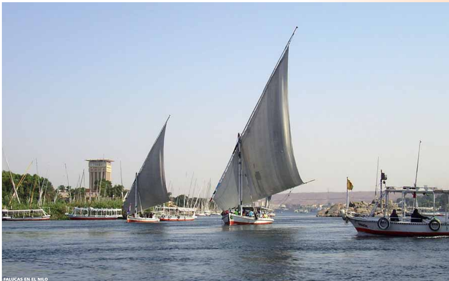
FALUCAS EN EL NILO

B Bonificación (reservas anticipadas) 5% | 8% PLAZAS LIMITADAS