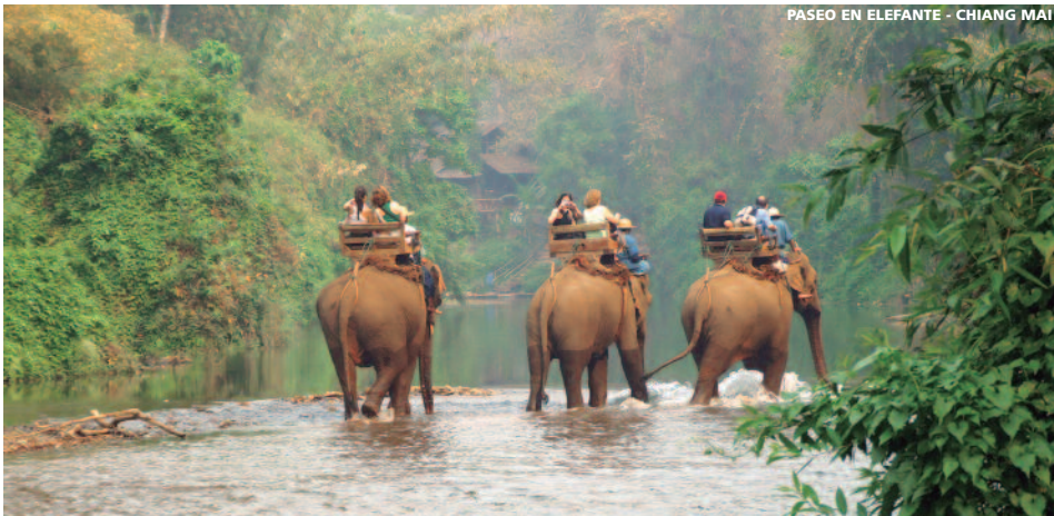
PASEO EN ELEFANTE - CHIANG MAI

10 días (7 hotel + 2n avión) desde 1.375 €