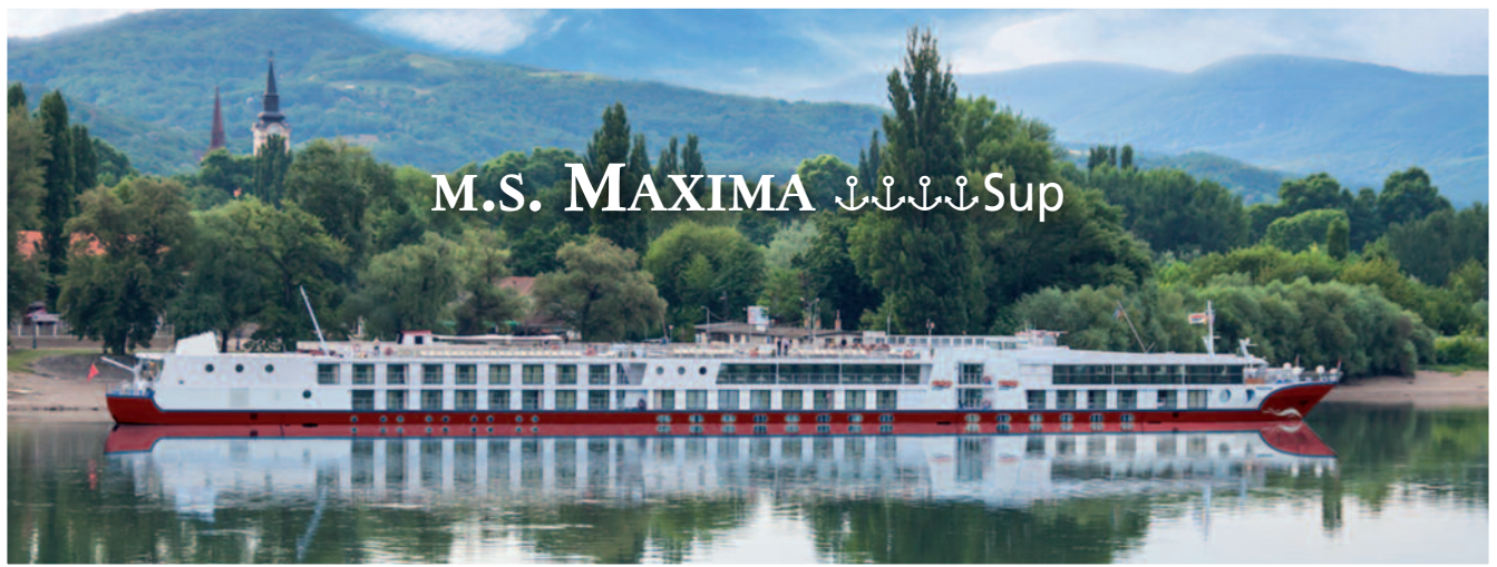
M.S. MAXIMA ⚓⚓⚓⚓ Sup