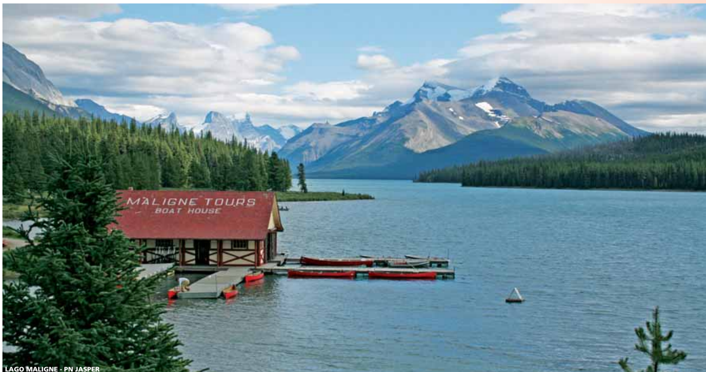
LAGO MALIGNÉ - PN JASPER

16 días (14n hotel + 1n avión) desde 2.355 €