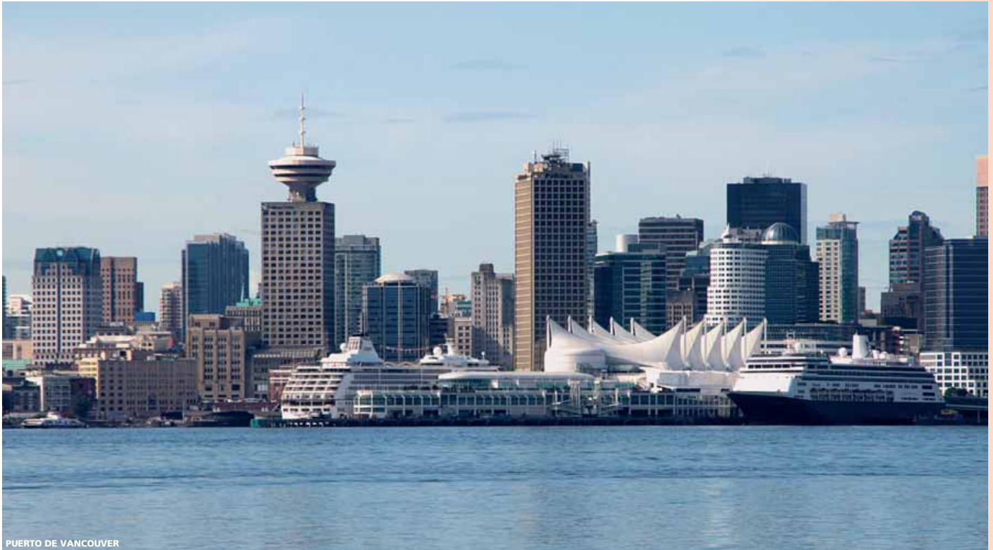
PUERTO DE VANCOUVER

21 días (19n alojamiento + 1n avión) desde 3.115 €