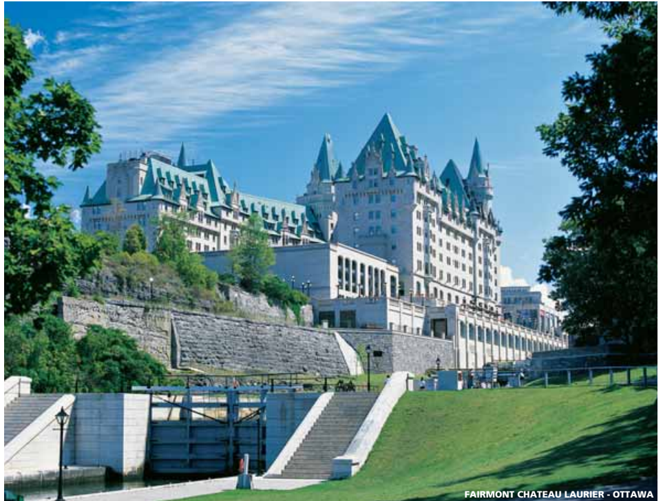
FAIRMONT CHATEAU LAURIER - OTTAWA