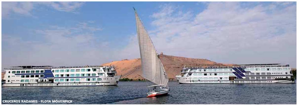
CRUCEROS RADAMIS - FLOTA MÖVENPICK