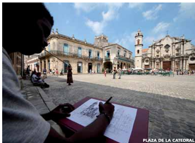
PLAZA DE LA CATEDRAL

La Habana es la ciudad con más influencia hispana del alegre Caribe: recorrer sus callejas de nuestro mejor estilo colonial, el puerto, sus museos, sus restaurantes de los años cuarenta, y sobre todo entrar en contacto con su población, experiencia muy rica desde el punto de vista humano, sorprendentemente amigable y educada, cuya comunicación consideramos imprescindible por la valiosa aportación humana que brinda.