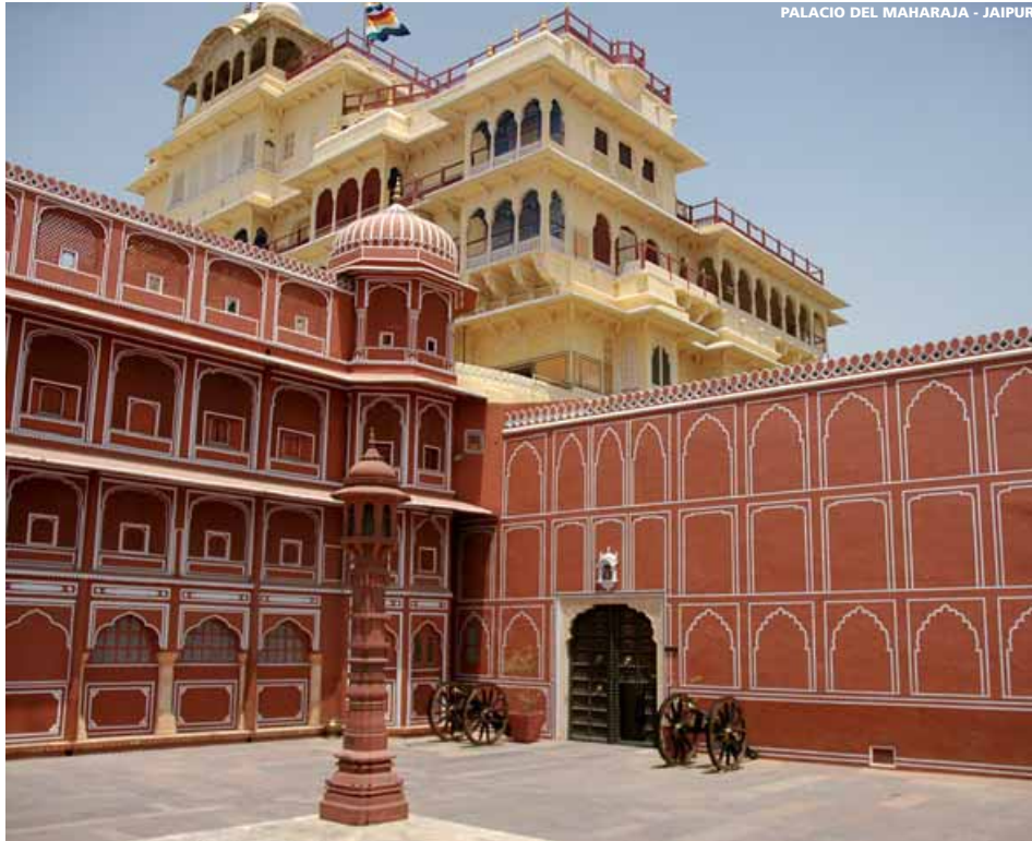
PALACIO DEL MAHARAJA - JAIPUR