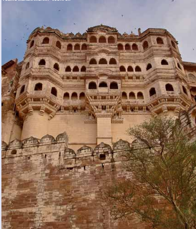
FUERTE MEHERANGARH - JODHPUR