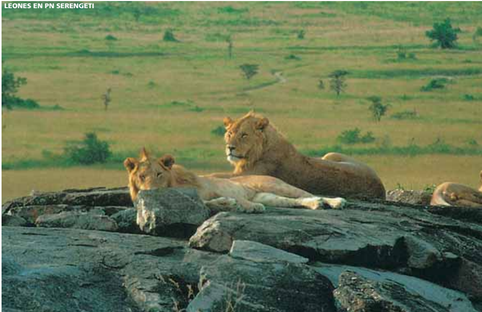
LEONES EN PN SERENGETI

Día 1º España/Kilimanjaro/Arusha Salida en avión con destino Kilimanjaro, vía ciudad/es de conexión. Llegada y traslado al hotel en Arusha . Alojamiento.