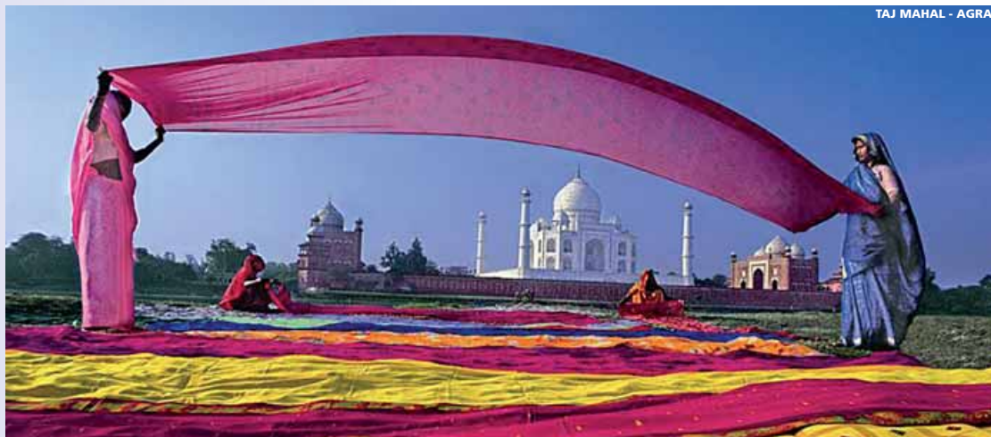
TAJ MAHAL - AGRA

• Jueves • Desayuno. Salida por carretera con destino Agra, visitando en el camino la ciudad abandonada de Fatehpur Sikri , construida por el emperador Akbar en el siglo XVI. Continuación a Agra , situada a orillas del río Yamuna, fue la capital del imperio mogol en su máximo esplendor. Visita del Fuerte Rojo cuyo interior conserva la Mezquita de la Perla y bellos palacios con esplendidas vistas del Taj Mahal. Visitaremos el Taj Mahal , obra maestra de la arquitectura mogol, monumento funerario construido por el Sah Jahan como símbolo del amor a su mujer Mumtaz Mahal, es hoy una de las maravillas del mundo. Alojamiento en el hotel.