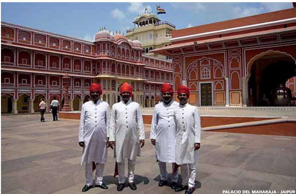
PALACIO DEL MAHARAJA - JAIPUR