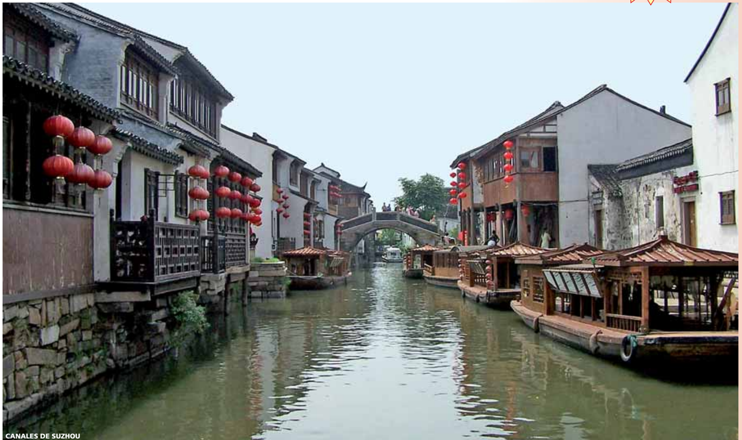
CANALES DE SUZHOU

yecto podremos observar desde el autobús el estadio olímpico "Nido de Pájaro" y el centro olímpico de natación conocido como el "Cubo de Agua". De regreso a la ciudad visitaremos un taller artesanal donde nos mostrarán el "Arte Milenario del Cloisonné". Para despedir nuestra estancia en Pekín asistiremos a un espectáculo de acrobacia, y a continuación disfrutaremos de una cena típica en la que degustaremos el famoso Pato Laqueado. Alojamiento en el hotel.