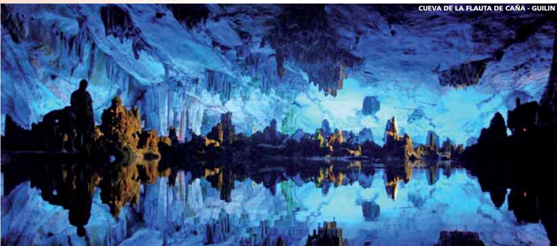
CUEVA DE LA FLAUTA DE CAÑA - GUILIN