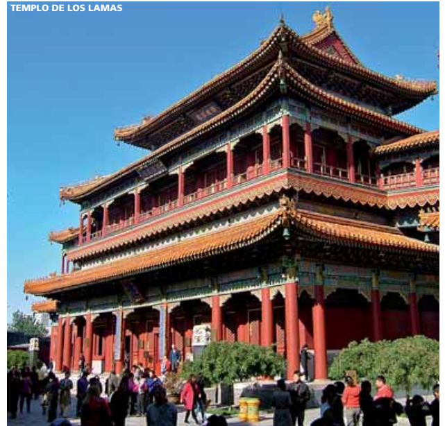
TEMPLO DE LOS LAMAS

En definitiva, Pekín es una ciudad inolvidable que a buen seguro quedará grabada en su memoria.