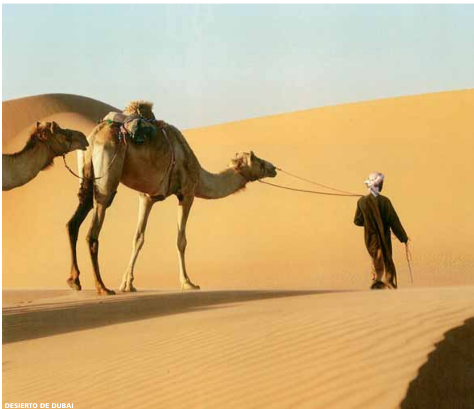
DESIERTO DE DUBAI