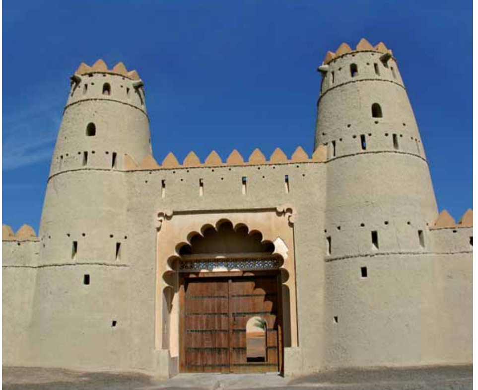
FUERTE DE AL AIN