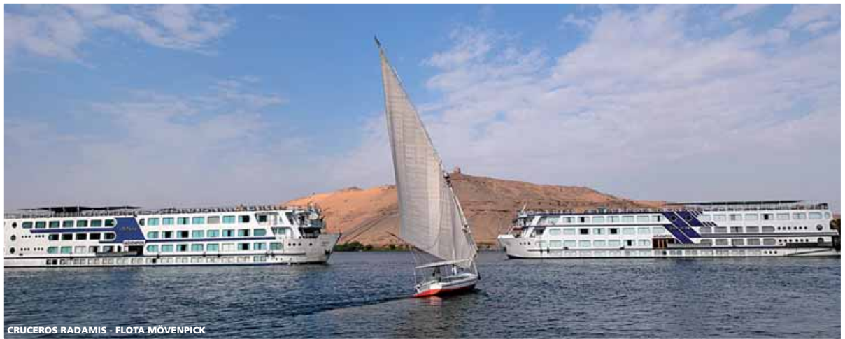
CRUCEROS RADAMIS - FLOTA MÖVENPICK