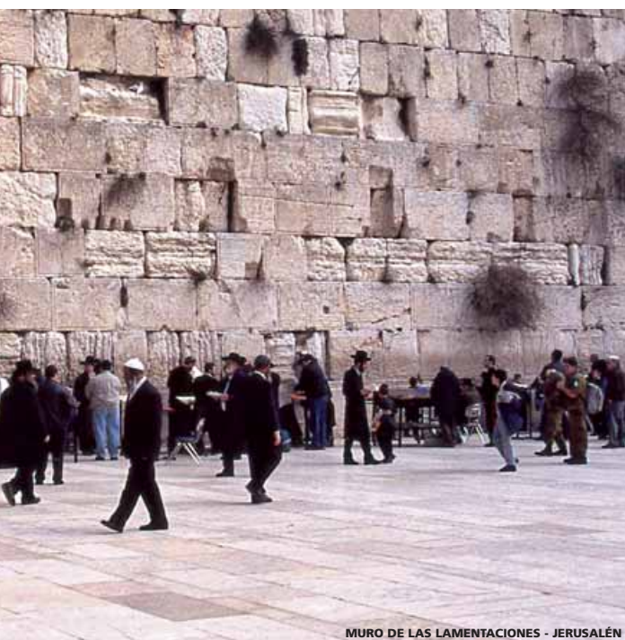
MURO DE LAS LAMENTACIONES - JERUSALÉN