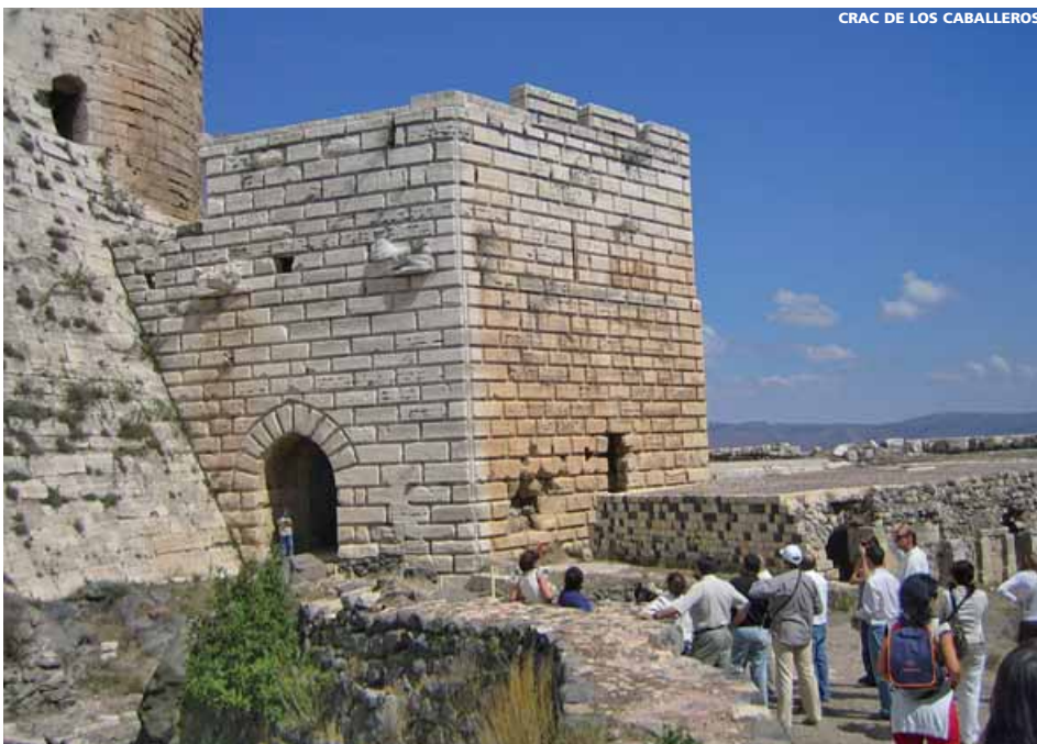
CRAC DE LOS CABALLEROS

11 días (10 noches de hotel) desde 1.350 €