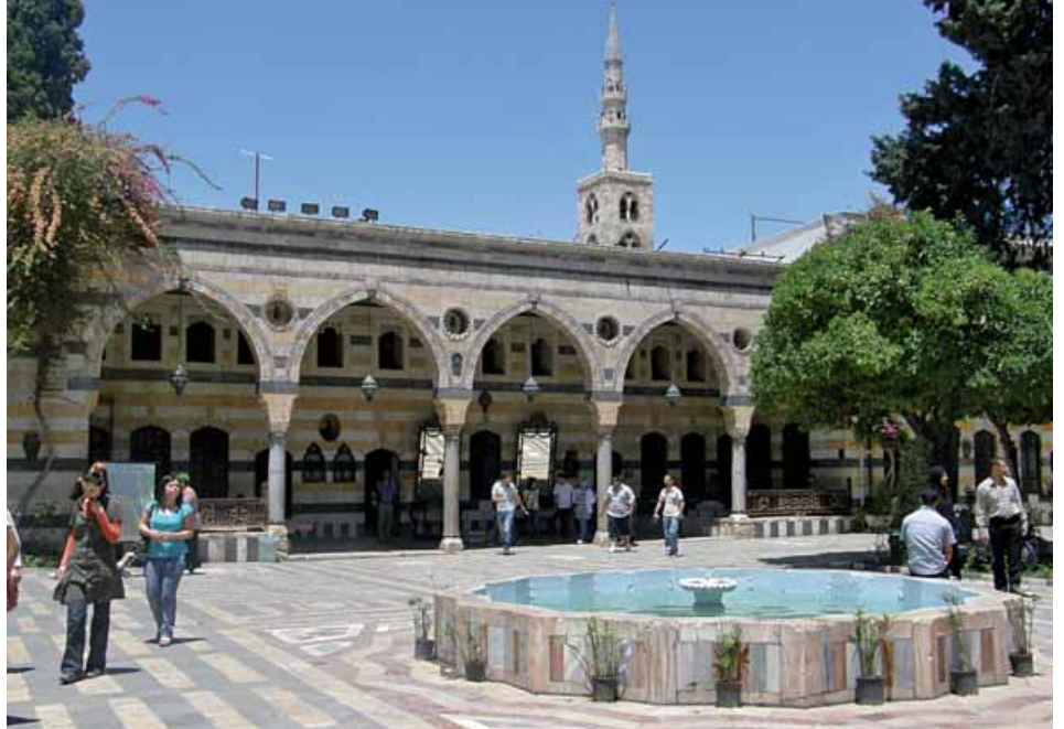
PALACIO AZEM - DAMASCO

Comienzo de la visita de la ciudad: La Ciudadela , base de la arquitectura militar árabe, la Gran Mezquita de los Omeyyas , lugar sagrado religioso y de culto. A continuación en las proximidades de Alepo, visitaremos la basílica de San Simeón el Anacoreta (una de las ciudades muertas). Basílica en estilo bizantino, que se adelanto prácticamente 5 siglos a su época. Por la tarde regreso a Alepo. Alojamiento