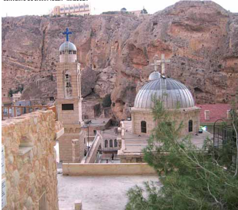
CONVENTO DE SANTA TECLA - MALOULA