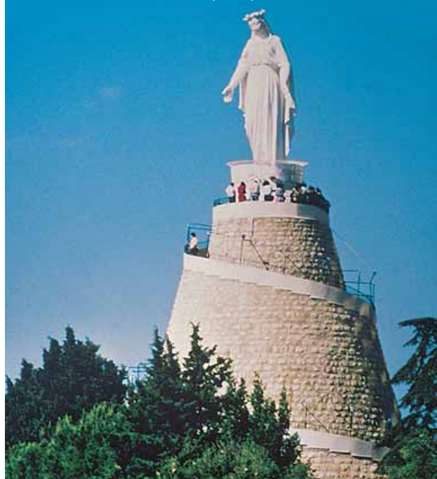
NUESTRA SEÑORA DEL LÍBANO - HARISSA (LÍBANO)

Visita del Museo Nacional y el centro de Beirut . Salida hacia la región del Chouf, zona verde y montañosa hasta llegar a Beiteddine , donde visi-