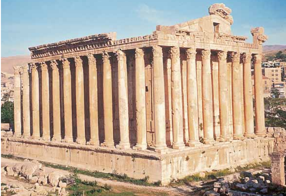
TEMPLO DE BACO - BAALBECK (LÍBANO)