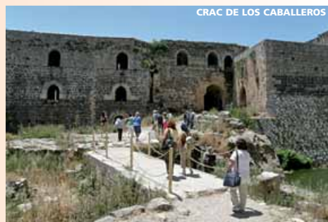
CRAC DE LOS CABALLEROS

NO debe figurar el sello o visado de Israel en el pasaporte.