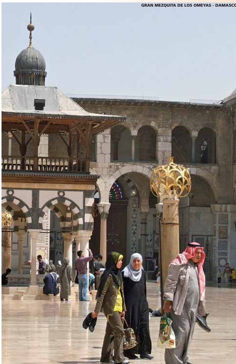
GRAN MEZQUITA DE LOS OMEYAS - DAMASCO