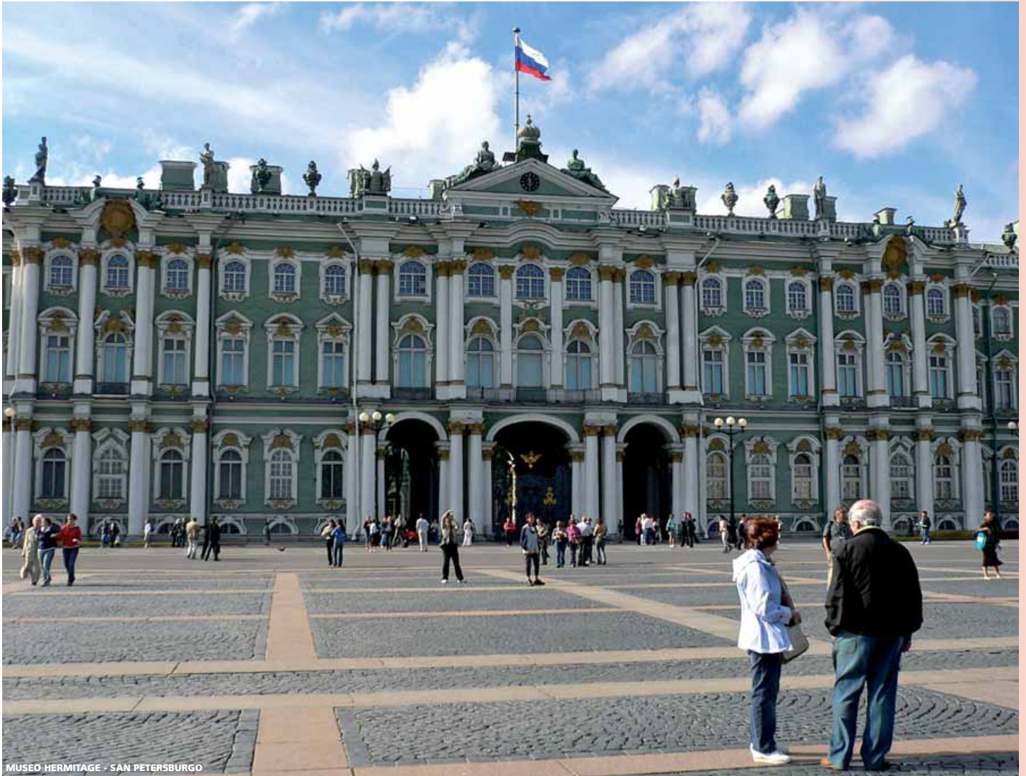
MUSEO HERMITAGE - SAN PETERSBURGO