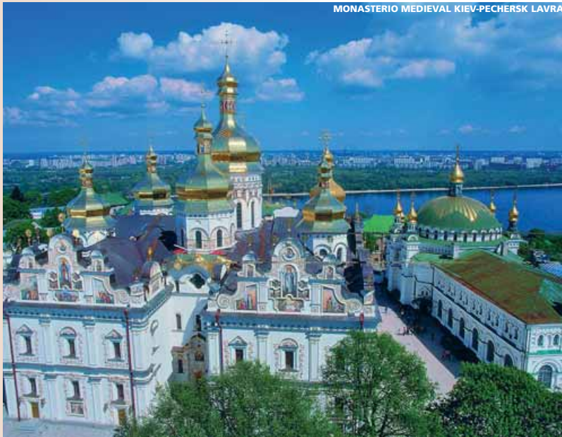
MONASTERIO MEDIEVAL KIEV-PECHERSK LAVRA

(Precios válidos del 1 de Abril al 30 de Diciembre)