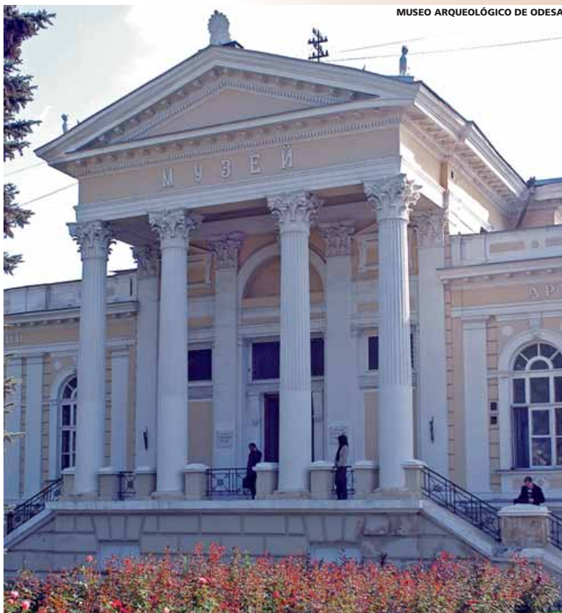
MUSEO ARQUEOLÓGICO DE ODESA

(Precios válidos del 1 de Abril al 30 de Diciembre)