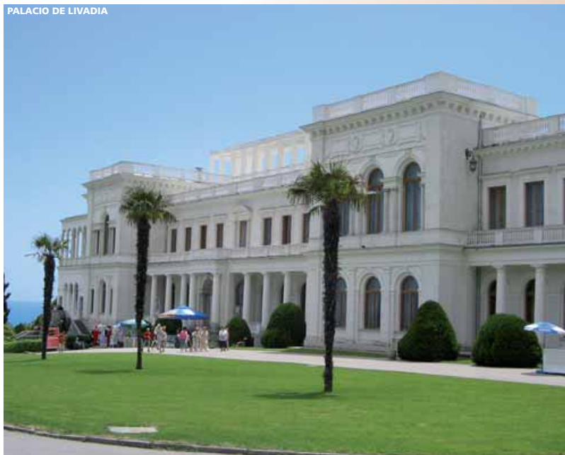
PALACIO DE LIVADIA

(Precios válidos del 1 de Abril al 30 de Diciembre)