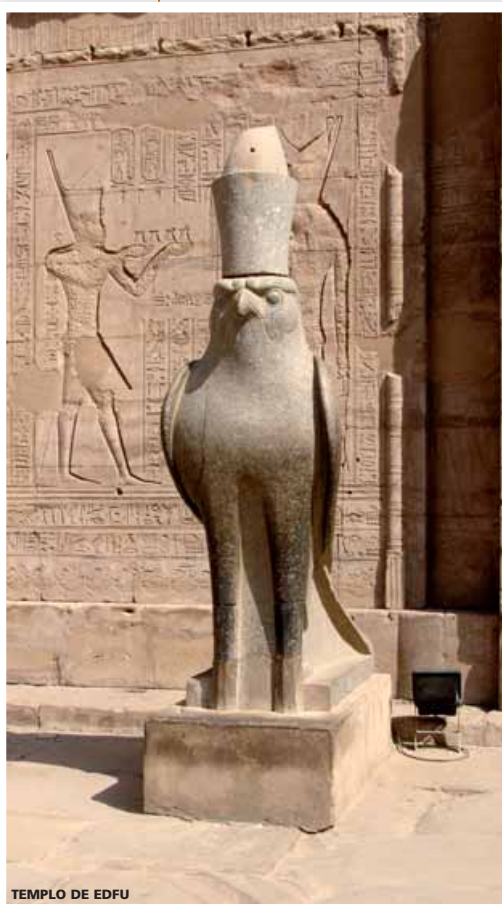
TEMPLO DE EDFU