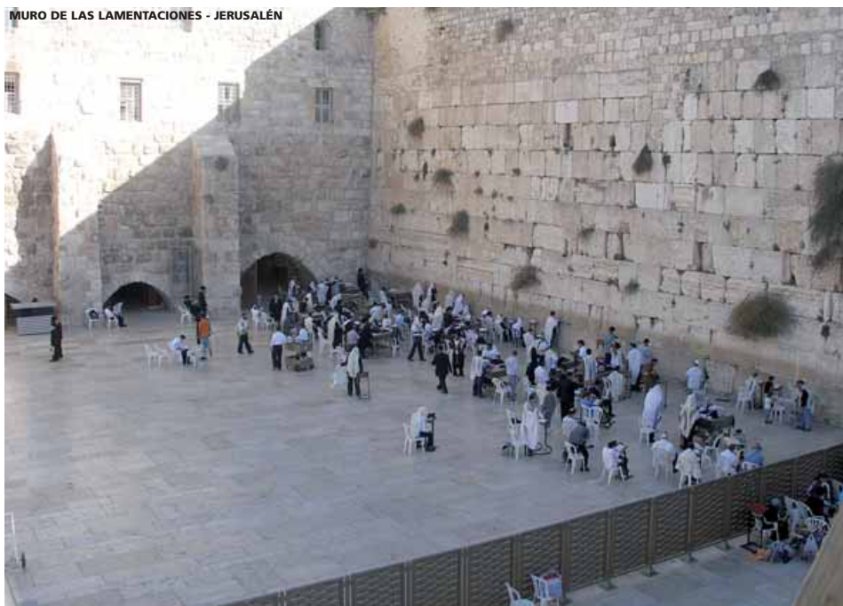
MURO DE LAS LAMENTACIONES - JERUSALÉN