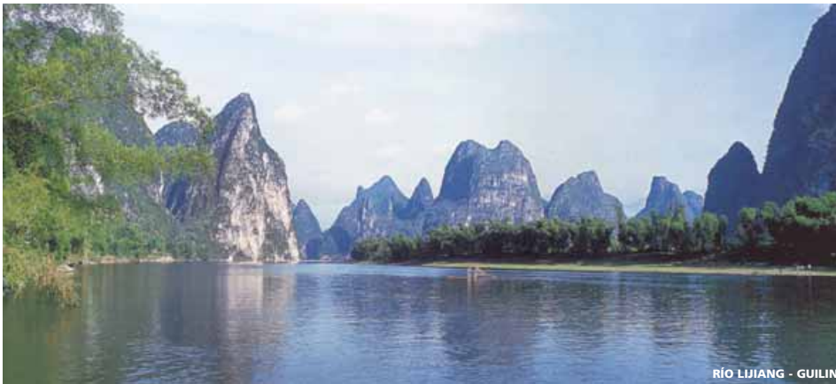
RÍO LIJIANG - GUILIN

(Incluidos Vuelos Domésticos Pekín/Xian/Guilín/Shanghai)